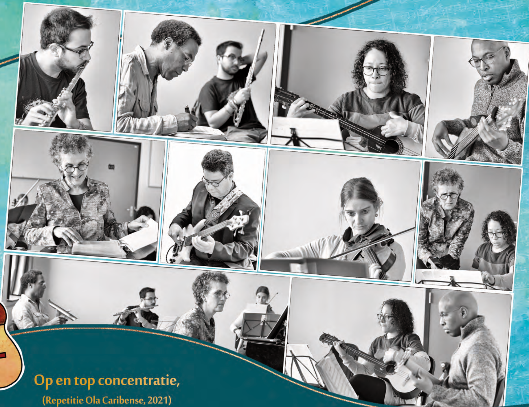
Op en top concentratie, (Repetitie Ola Caribense, 2021)